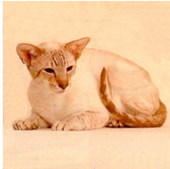
Sup.UK.Gr.Ch. Tabbra Bon Chance