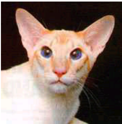
Sup.Gr.Ch. Soria Sanjo Panza

indtil 1995 på deres næste Supreme-titel-vinder. Denne gang var det Mrs. S. Brook's bruntabbymaskede Sup.UK.Gr.Ch. Brookwell April Rose. I 1997 triumferede de tabbymaskede igen, denne gang i form af den chokoladetabbymaskede Sup.UK.Gr.Ch. Tabbra Bon Chance, opdrættet og ejet af Mrs. E.Myles. Det er stadig de tabbymaskede, der bestemmer farten i siameserverdenen. Åben klasse er ofte godt fyldt op hos de tabbymaskede, og deres antal overstiger ofte de fuldmaskedes. De bliver nu opdrættet aktivt i alle de nye farver.