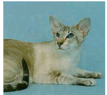
Sup.Gr.Ch. Moondance Jocasta

I 1966 fik Spotlight Penny Lynx sin Champion-titel som den første. Hun var efter en parring mellem Whiteoaks Malahide og Praline. Snart fik andre katte titler, deriblandt Mrs. D.Yorke's Ch. Reoky Cheetah. I 1971 oprettede GCCF den nye titlen Grand Champion, og den første, der