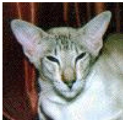
Sup.UK.Gr.Ch. Brookwell April Rose