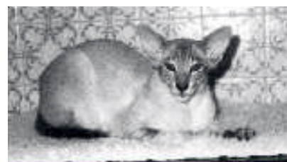
Gr Ch Shermese Tigers Eye