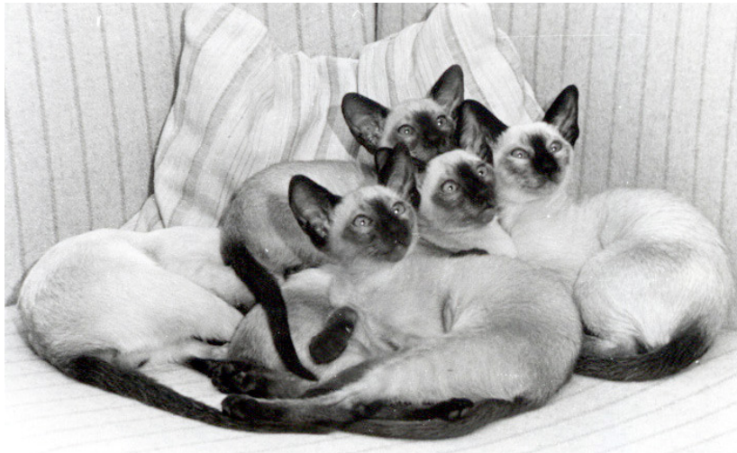
Klingeskov's kuld anno 80

Vi har købt 21 katte indtil nu, af dem har de 15 været udenlandske, primært til forbedring af forskellige ting. San-T-Ree Dark Mascot købte vi af Eiwor Andersson i 1983. Han betød utroligt meget. Vi sprang et par generationer over med ham som avlshan. En hunkat efter