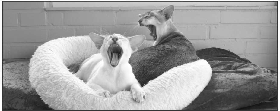
Vil du se vores tænder?

Desuden skal man som ejer være opmærksom på sin kats opførsel, når den spiser. Her kan små variationer nemlig være tegn på, at noget i munden gør ondt. F.eks. kan katten være længere om at spise end normalt. Den flytter måske maden lidt rundt inde i munden, før den knaser, eller den foretrækker blødkost frem for tørkost. Det kan endda være, at den tigger om mad, men lader maden stå, når den bliver serveret. Alle ændringer kan være tegn på, at noget med spisesituationen er ubehageligt. Brug også næsen! En kat med dårlig